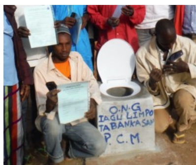
toilet in Guilege