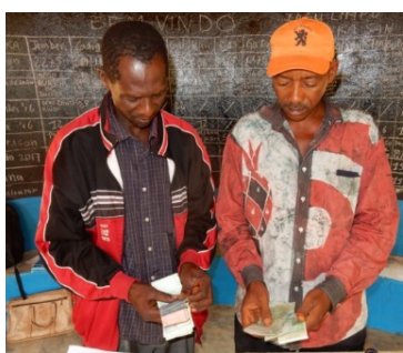
Eigen bijdrage is essentieel.

Website: De MANUAL van de Calabash Tank staat op de site. U kunt hier ook jaarverslag en jaarcijfers 2016 vinden.