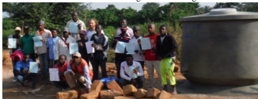
Nederlandse student Water Management tijdens training voor Calabash Tank in Afrikaans dorp.