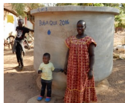
nu ook op Bubaque, Archipelago Bijago